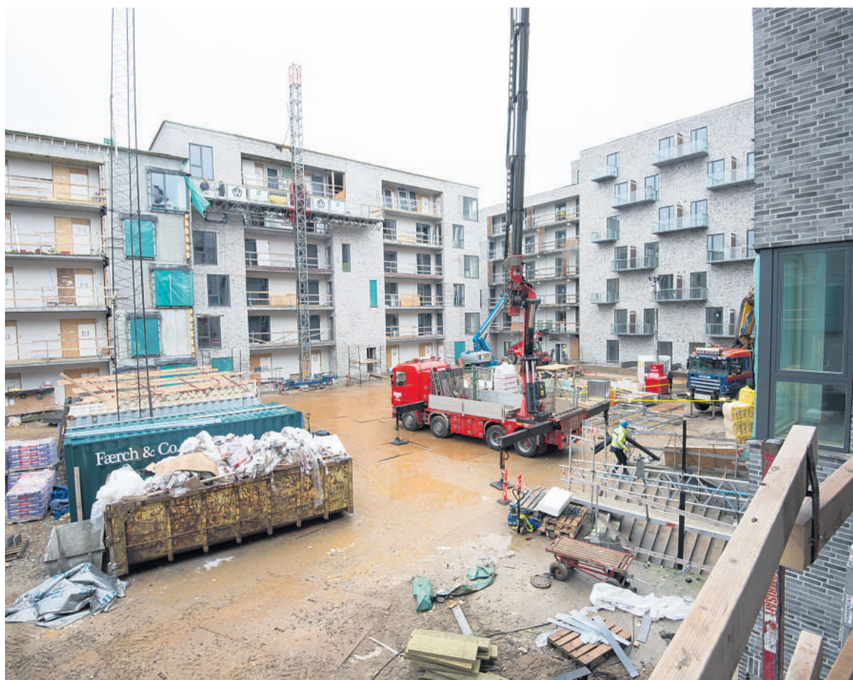
230 lejelejligheder i karréen Bryggerhaven er klar til indflytning i maj, juni og juli. Og det store gårdrum skal nok ende med at invitere til udeliv.