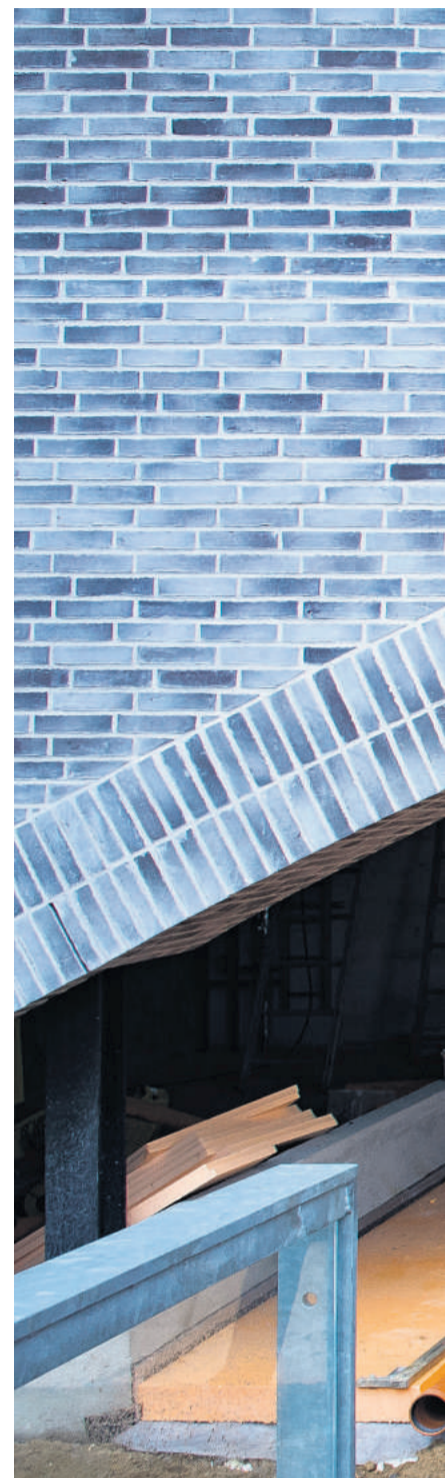
Jamen hov, er der ikke lidt Aarhus Universitet over den buede gennemgang ind til det indre af bebyggelsen Bryggerhaven i Ceresbyen. Jo, det er der. Bryggerhaven er tegnet af C F Møller, der også har tegnet universitetet.