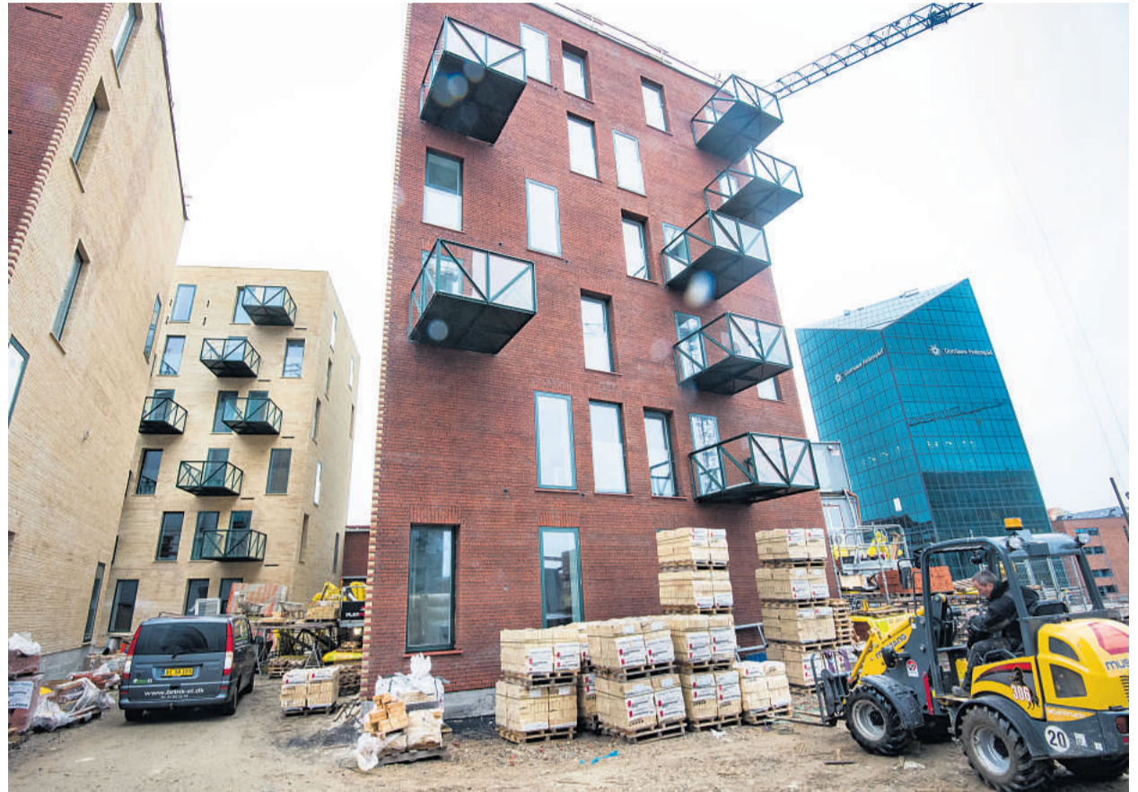
Røde sten på forsiden og gule på bagsiden - som man kender det fra ejendommene i den ældre del af byen. Sådan ser den mere rå bebyggelse, Lottrupgården ud. Råt er der også inde i lejlighederne, hvor betonvæggene ikke er skjult men blot har fået en gang lak.