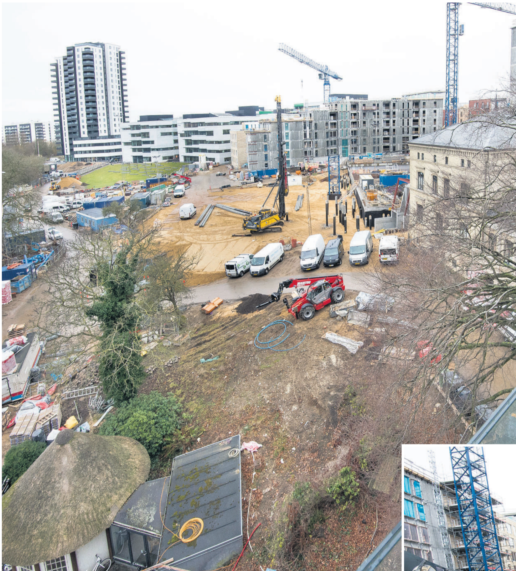
Et altankig fra 5. sal mod højhuset Ceres Panorama og resten af Ceresbyen - og mod det, der om et par år er genetableret som Ceresparken ned mod åen.

En række arkitektfirmaer har tegnet forskellige dele af den nye bydel: CF Møller, Sahl Arkitekter, Arkitema Architects og Schmidt Hammer Lassen.