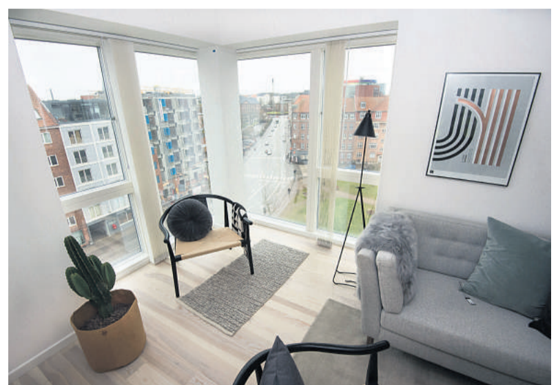
Hjørnelejlighederne i Ceres Hus byder på et fint kig mod byen og regnbuen over Aros.